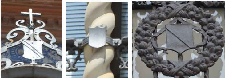
Edificio Pedro Roldán