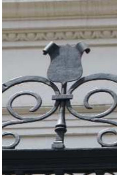
Edificio Avda de la constitución nº 12