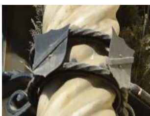
Edificio c/San Tomás nº 4