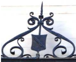
Edificio Cuesta del Rosario esq . c/Jesus de la Pasión