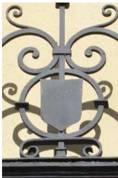
Edificio Cuesta del Rosario, nº16 esq. c/Luchana

Pero también firmará sus obras con un escudo que en la mayoría de las veces aparece con una banda cruzada. ¿Qué significado tiene este escudo?, ¿por qué lo utiliza continuamente en las rejas de las ventanas, en las barandas de los balcones, en las puertas y en los paramentos de los edificios?